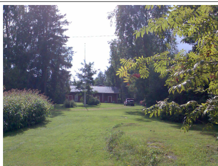
Toivolan aitta Heposelän rannalla, jossa asuimme kesän 1947