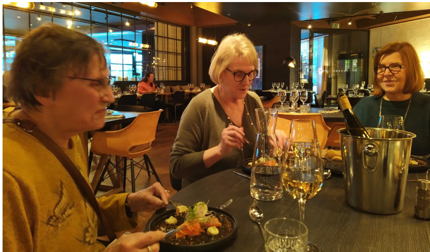
Ainin veljet vaimoineen asuivat Kimmelissä muitotilaisuuden ajan.