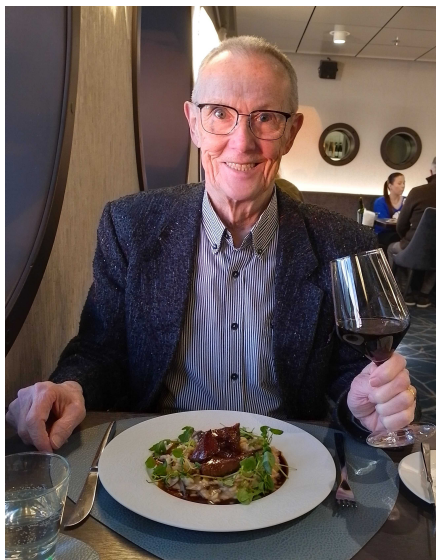
Matkalla Ainia saatonle 2023